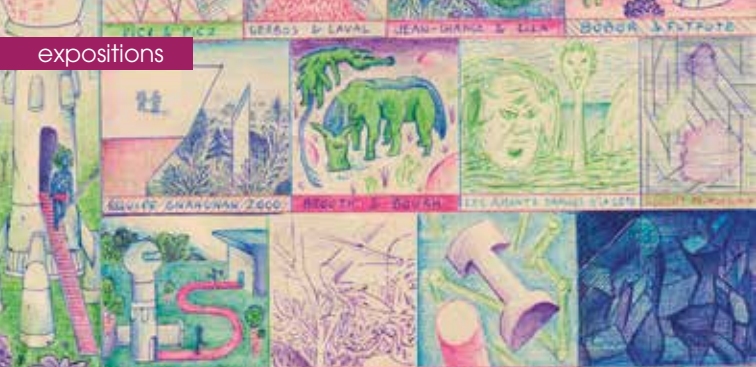
► Planète 2 © Beck