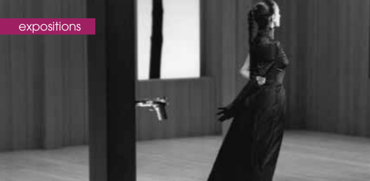
► Bob Wilson Une femme Douce