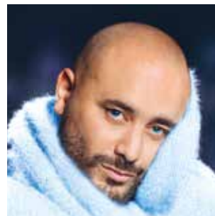
► Jérôme Commandeur

Programme détaillé sur : https://casino-aix.partouche.com/