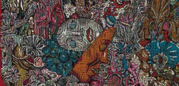
► À la racine © Stéphane Blanquet - Diamant

Dessiner une « tête de mort » en s'inspirant des différentes influences artistiques des auteurs présentés. A partir de pochoirs, de différents outils et matériaux (tissus, papiers, feutres, craies), chaque enfant réalise une œuvre aux couleurs de la vie !