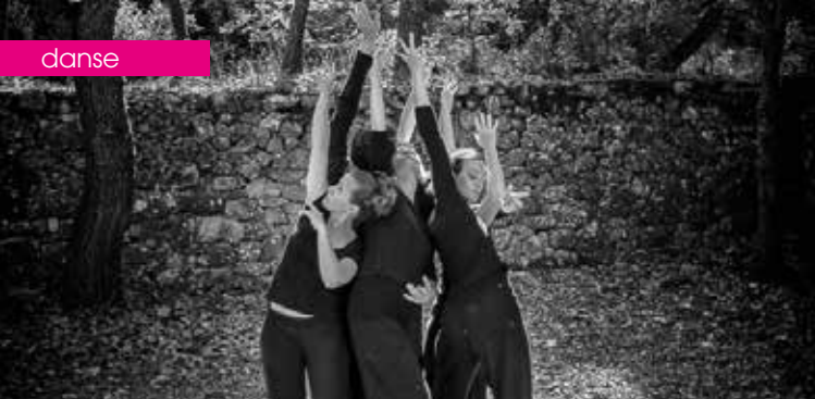
► Arbres en danse