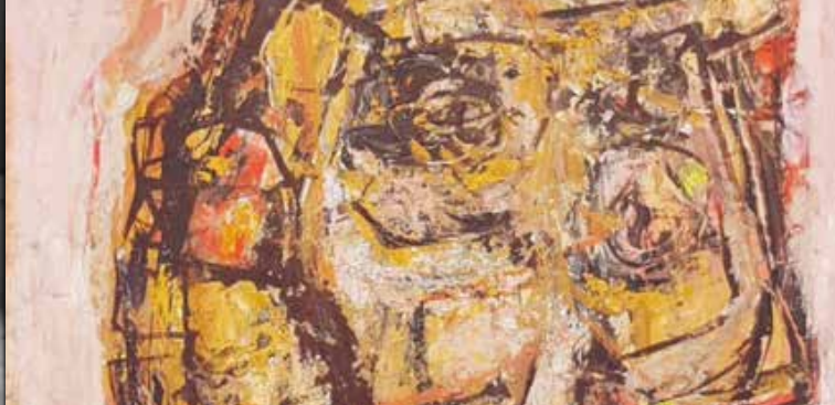
► © Jean-Marie Sorgue - Tête, huile sur carton c.1965

Renseignements : espace361.com - contact@espace361.com