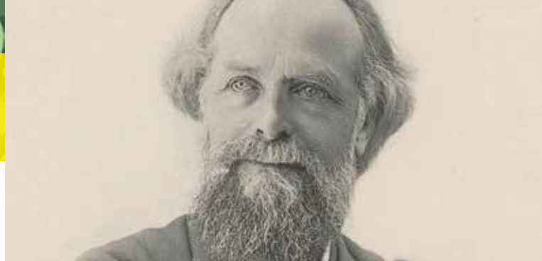
► Elisee Reclus