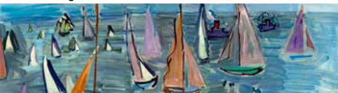
► Raoul Dufy, Regatta , 1935, oil on canvas, 73 x 92 cm, the Musée d'Art Moderne de la Ville de Paris, photo: Paris Musées/Musée d'Art Moderne, © Adagp, Paris, 2022

Renseignements : 04 42 20 70 01 - www.caumont-centredart.com