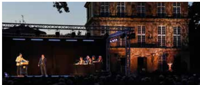
► © Ville d'Aix

Nos rhéteurs s'affronteront sur les thèmes les plus divers. Ils se feront poètes ou philosophes, comiques ou sérieux, pour vous convaincre, vous émouvoir, vous emporter.