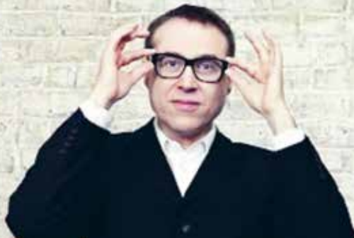
► Conférence rencontre avec Jean François Zygel

Tarif : 10€ (durée 2h, réservation sur le site)