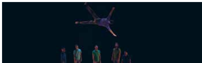
► Esquive