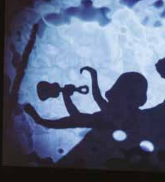
► Le fabuleux voyage de la fée mélodie