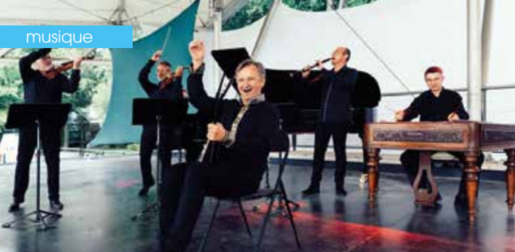
► Sirba Octet