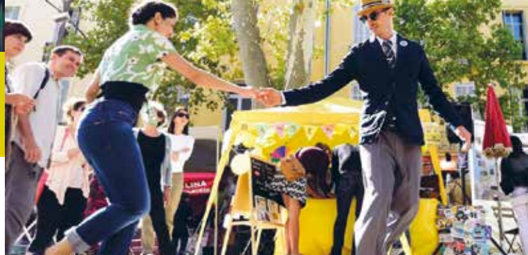
► Swing Saint Germain

À vos marches vous invite pour deux chasses au trésor dans le centre-ville d'Aix-en-Provence sur le thème de la flore de la ville.