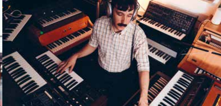
► Forever Pavot © Antoine Magnien