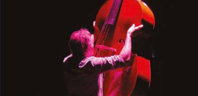
► Soirée d'ouverture : La contrebasse