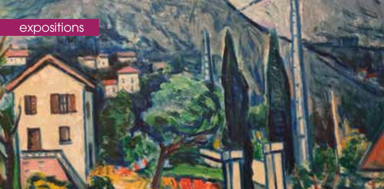
► Raphaël Arnal