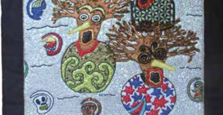
► La forêt, perles et sequins © William Adjete