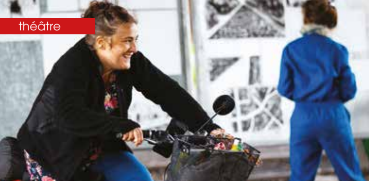
▶ Nez au vent © Kalimba