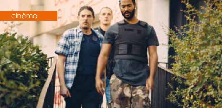
► Les Misérables