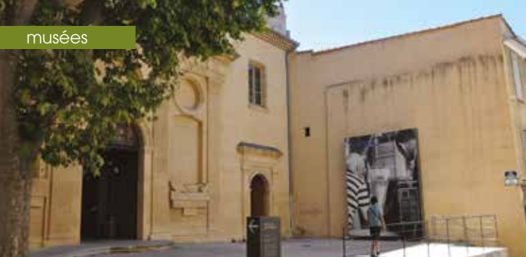
► Granet XX e , la chapelle des Pénitents blancs