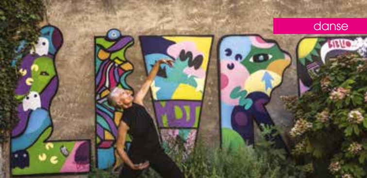
▶ Arbres en danse Cie Marie hélène Desmaris

👉 Retrouvez en détail les lieux d'implantation et la présentation des groupes sur le site aixenprovence.fr