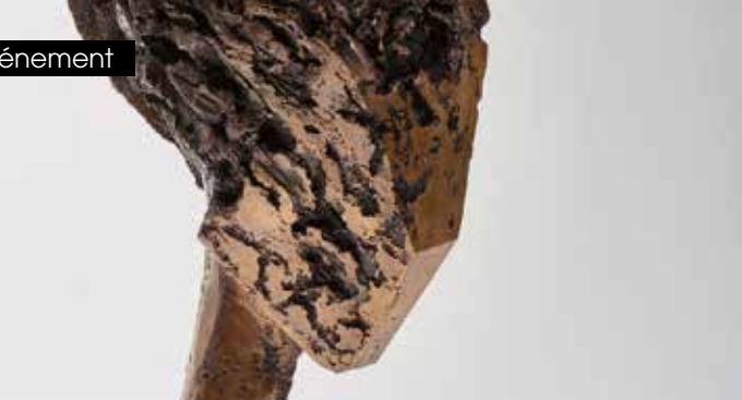
► Puiser dans l'orage le goût des mots © Luisa Rampon