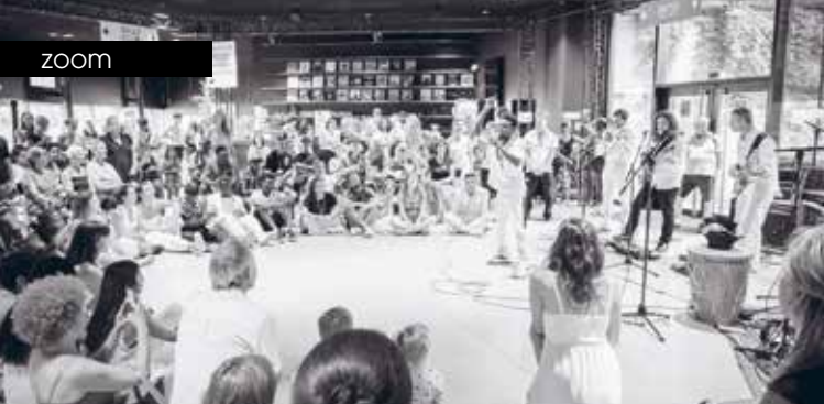
► Spectacle participatif de Passerelles