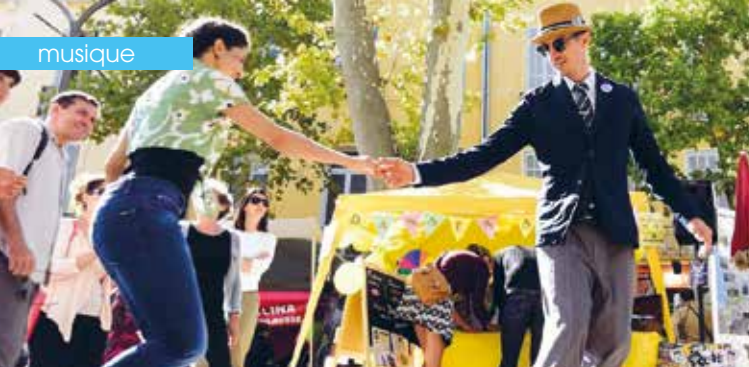
► Swing saint Germain