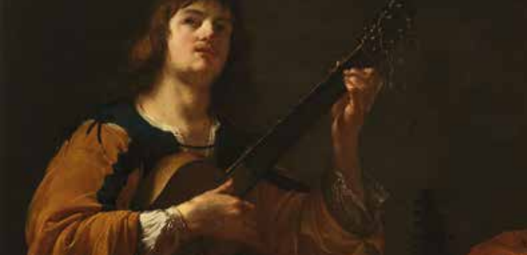
► Autoportrait en guitariste - Jean Daret, 17 e s. Huile sur toile 128x101cm