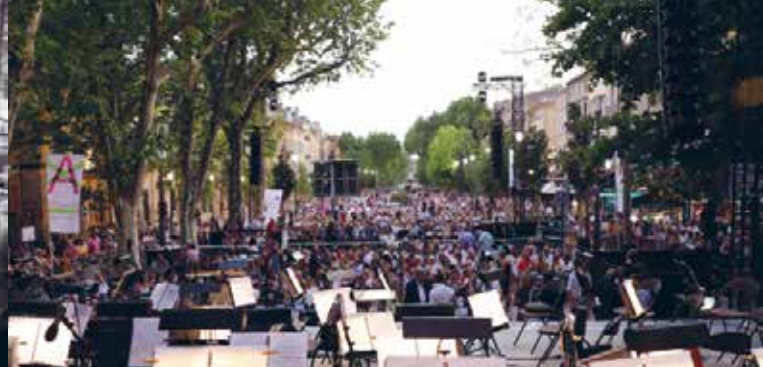
► Parade[s] Juin 2019