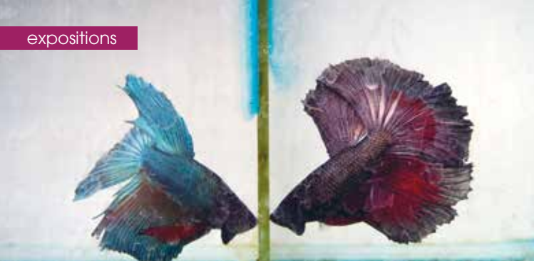
► Photocontact © Claude Durand