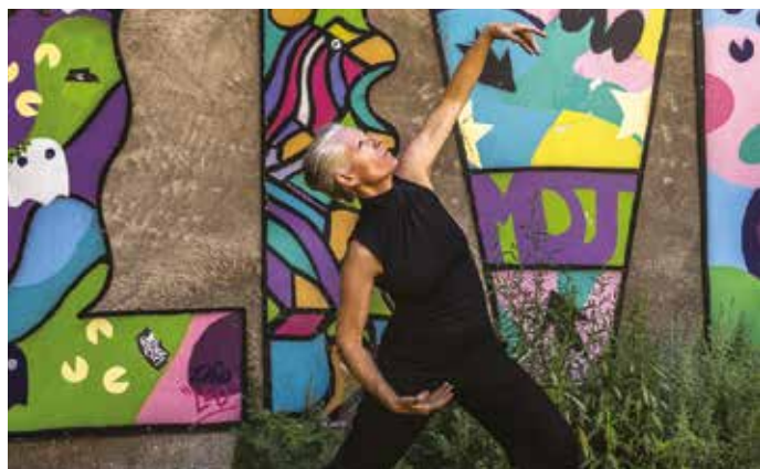
▶ Arbres en danse Cie Marie hélène Desmaris