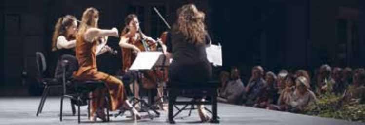
► Concert de l'Académie de musique de chambre, 29 juin 2022