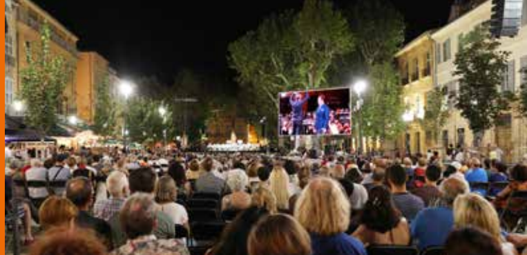
► Festival Aix en Juin Parade[s]

AIX EN JUIN 8—30 2023 AIX EN JUI AIX EN JU CONCERTS AIX EN J SPECTACLES AIX EN PARADE[S] AIX E AIX AI A