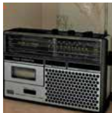
► Les vieux

Parallèlement à la photographie, j'accompagne des personnes âgées dépendantes. Grâce à cette présence quotidienne, ils m'ont acceptée jusque dans leur intimité. J'ai pu rendre visible l'invisible. Ils sont au centre de mon projet professionnel et photographique. Ces images sont un témoignage de leur quotidien.