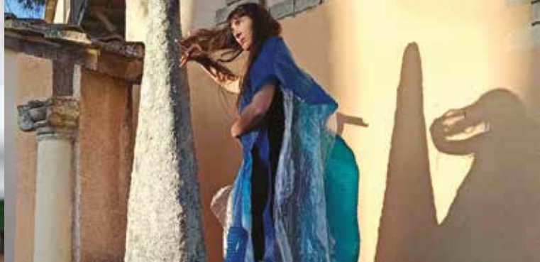
▶ Spectacle de voix et mouvement

▶ Café théâtre le Flibustier 7 rue des Bretons Renseignements : 04 42 27 84 74 - leflibustier.net