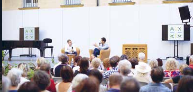
► Panorama 13 juin 2022