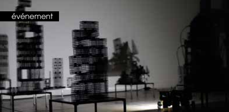
► Thomas Garnier - Taotie ©Thomas Garnier