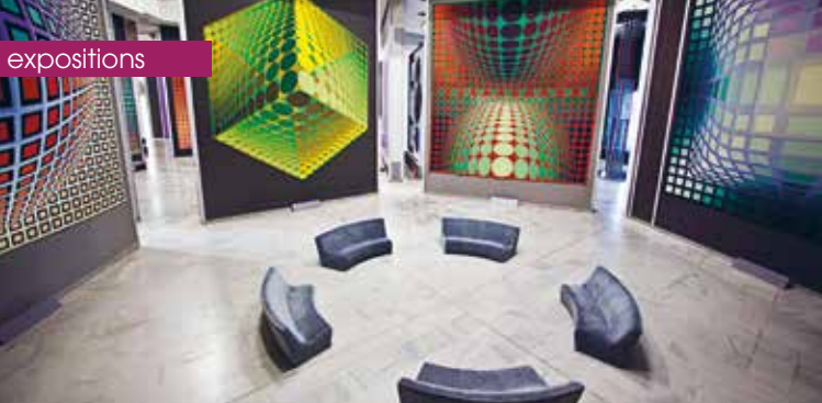
► AnVéole ©TUPRA, Victor Vasarely, © ADAGP, Paris, 2022, 1972 & ©bOND, Victor Vasarely, © ADAGP, Paris, 2022, 1968