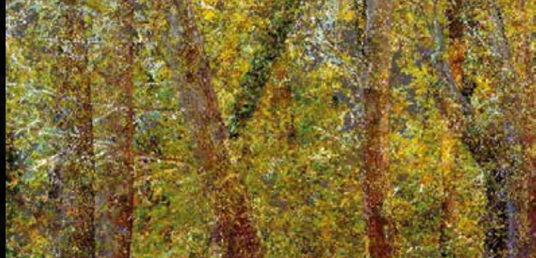
► Pointillisme - © Quayola