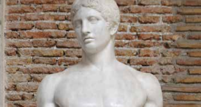
➔ Doryphoros Man Napoli

Renseignements : 06 37 26 91 62 - contact@up-aix.com - up-aix.com