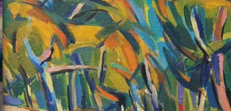
► Paysage Fauve , 1953 © Claude Vallet