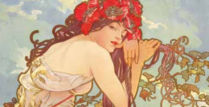
► Alphonse Mucha, L'Été , série Les Saisons , 1896, Lithographie en couleurs, 27,5 x 14 cm