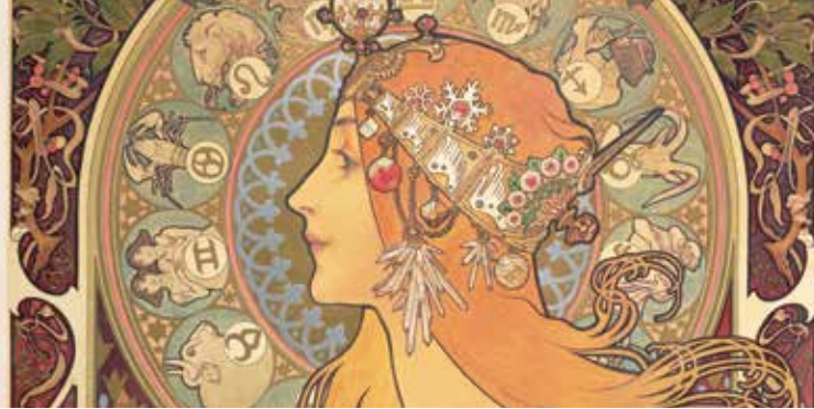
► Alphonse Mucha, Zodiac , (détail) 1896, Lithographie en couleurs, 65,7 x 48,2 cm © Mucha Trust 2023