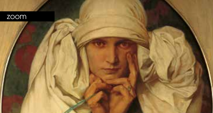
► Alphonse Mucha, Portrait de Jaroslava (détail), 1927-30, Huile sur toile, 73 x 60 cm © Mucha Trust 2023