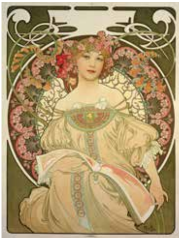
► Alphonse Mucha, Rêverie , 1898, Lithographie en couleurs, 72,7 x 55,2 cm © Mucha Trust 2023

de Mucha sont toutes autres : il se veut plus engagé et aspire à créer des œuvres aux desseins plus nobles afin de mettre son art au service de son pays et de tous les peuples slaves au nom d'une fraternité universelle. Franc-maçon actif et ardent défenseur des peuples slaves, il développera toute sa vie un art qui se veut libérateur, en lui donnant une identité à la fois tchèque, slave, mais aussi humaniste.