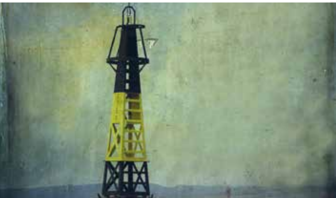
► La Balise