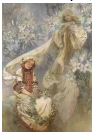
► Alphonse Mucha, La Vierge aux lys , 1905, Tempéra sur toile, 247 x 182 cm

La cinquième Exposition universelle de Paris se tient en 1900 et célèbre l'avènement du XX e siècle ainsi que les progrès accomplis par l'humanité depuis cent ans. L'Exposition universelle est perçue comme l'occasion idéale de promouvoir l'Art nouveau. Alphonse Mucha est alors l'artiste le plus célèbre de l'Empire austro-hongrois, qui le charge de la décoration de son affiche ainsi que du grand hall du Pavillon de la Bosnie-Herzégovine et du menu de son restaurant. Pour sa première ébauche, il propose d'illustrer les souffrances du peuple bosniaque mais cette idée initiale est censurée par l'Empire au profit d'une illustration idéalisée de l'histoire de ce peuple. Cet événement déclenche chez l'artiste une profonde prise de conscience sur le message qu'il souhaite véhiculer à travers son art, qu'il veut libérateur. Son œuvre bascule désormais dans une aspiration plus engagée au service de l'humanité.