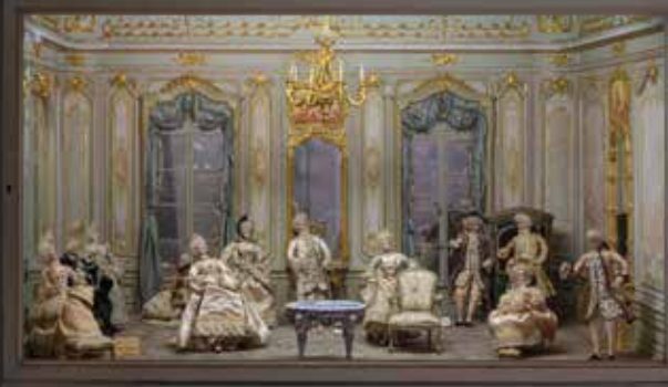
► Salon de l'Hôtel de Soubise de Madame Laurin

► Retrouvez les informations de l'exposition sur www.lab-gamerz.com