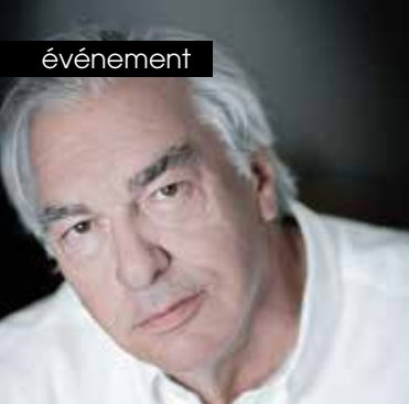
▶ Didier Decoin