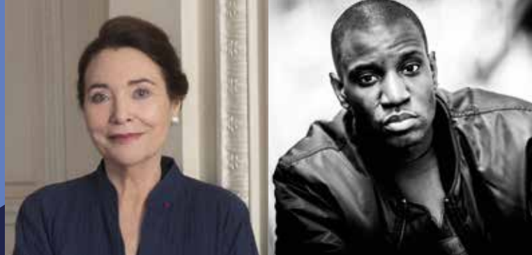
▶ Paule Constant

Abd Al Malik a rencontré Camus dans les pages de ses livres... cela a forgé son devenir d'artiste. Cette lecture musicale est un hommage aux textes de Camus et une réflexion sur son œuvre.