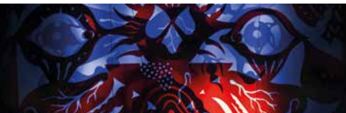
► Les leçons d'anatomies chimériques