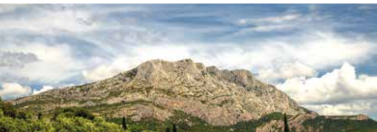
► Sainte victoire

► LECTURE ITINÉRANTE EN BUS de «La leçon de la Sainte-Victoire» de Peter Handke ► À 9h30 départ du théâtre des ateliers