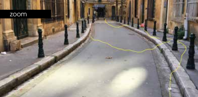
► Chemins de désir