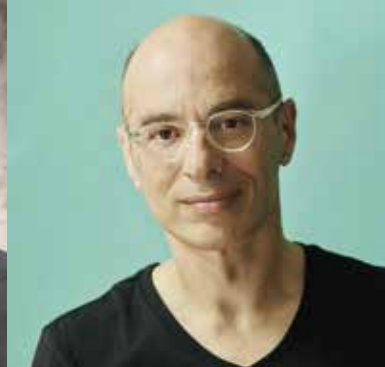
▶ Bernard Werber