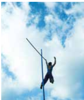
Bleu Tenace