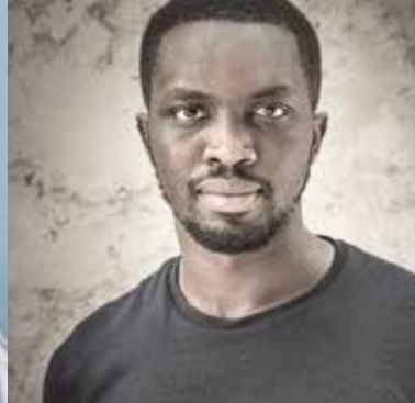
▶ Mohamed Mbougar Sarr

avec Jean-Pierre Luminet , autour de son livre (Buchet Chastel).