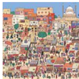
► Extrait-Deville en ville © Emilie Plateau

Dans la continuité de l'exposition, « Zai Zai Zai Zai Attitude », ce trio d'auteurs amis et complices de Fabcaro présente une sélection d'œuvres thématiques. Chacun à travers sa ligne graphique, son vécu, son univers et sa sensibilité d'artiste, nous propose des fragments de vie. Sensibles, fragiles, réalistes et parfois agités, ils témoignent de la société mais aussi de notre place dans un contexte social, politique et humain parfois difficile.