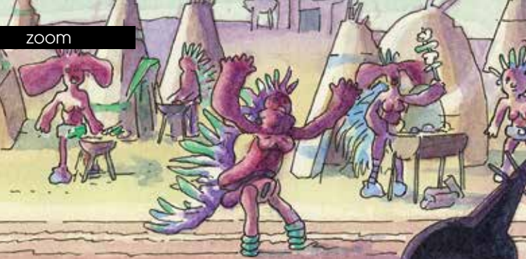
► Planète 2 © ThierryVanHassel