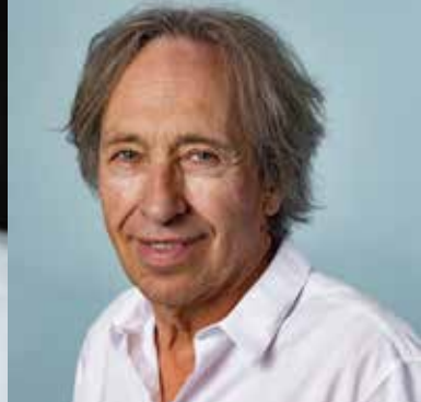
▶ Pascal Bruckner