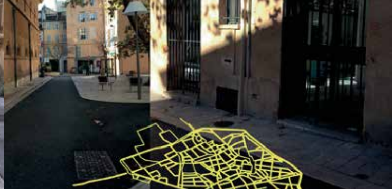
► Chemins de désir

► BIBLIOTHÈQUE MÉJANES-DEUX ORMES ► De 10h à 13h et de 14h à 18h exposition Rencontres du 9 e art Anna qui chante. ► De 14h30 karaoké révolutionnaire.