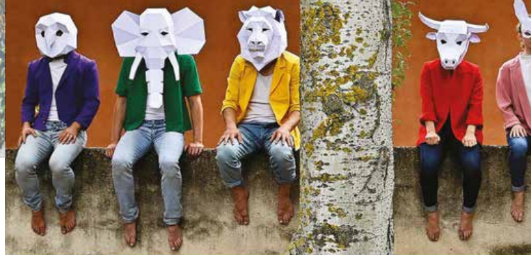
► Jeu de piste

► BIBLIOTHÈQUE CÉZANNE ► À 16h Archipel(s) , balade poétique avec Marien Guillé. ► À 18h vernissage La Langue des oiseaux exposition mise en mots et scénographiée par emmanuelle Bentz en partenariat avec le Muséum d'Histoire Naturelle, la LPO.