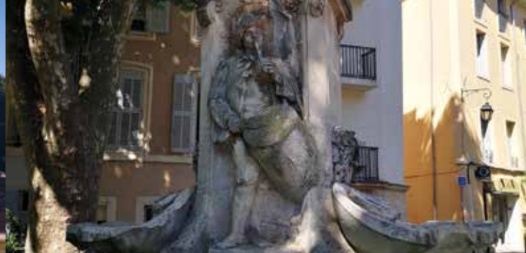
► Fontaine Pascal, cours Sextius