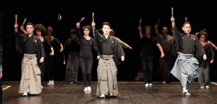
► Master class Ryochi Kano - Conservatoire National Supérieur d'Art Dramatique Paris 2015