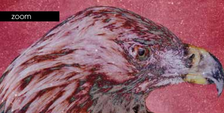
► ZOO Parallax