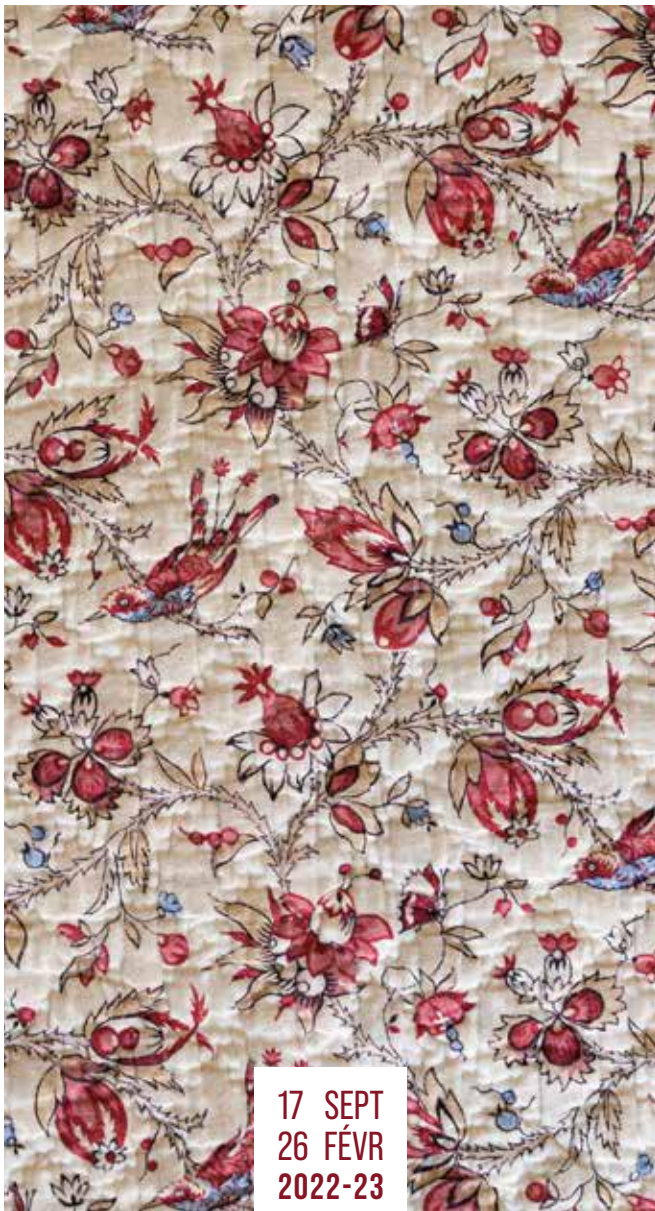
Détail d'un lapon en coton piqué à motifs d'oiseaux de paradis et de fleurs, fabrication provençale, XIX e siècle, Avenir-Provence, Musée du Vieil-Aix.