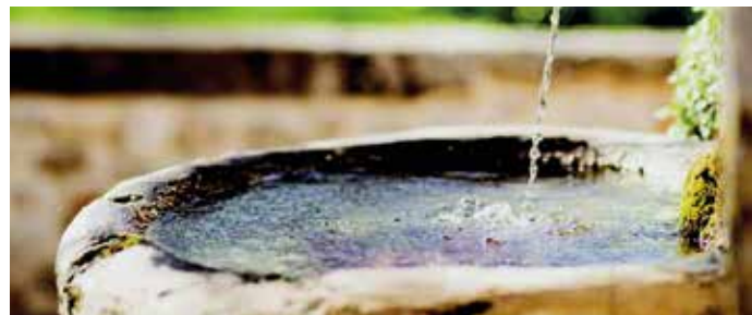
► Fontaine du château de Beauré