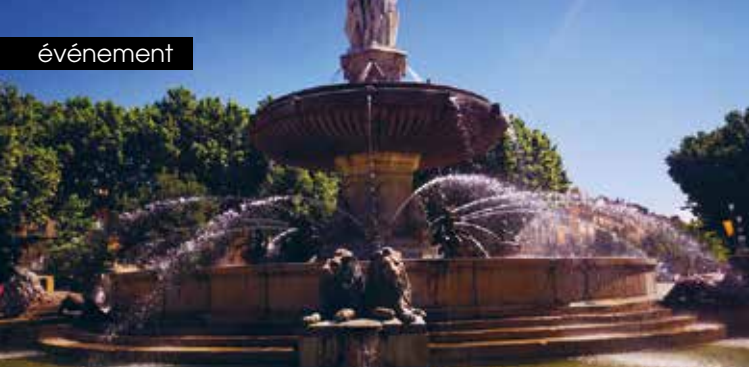
► Fontaine de la Ronde (1859 début construction, mise en eaux 1875)