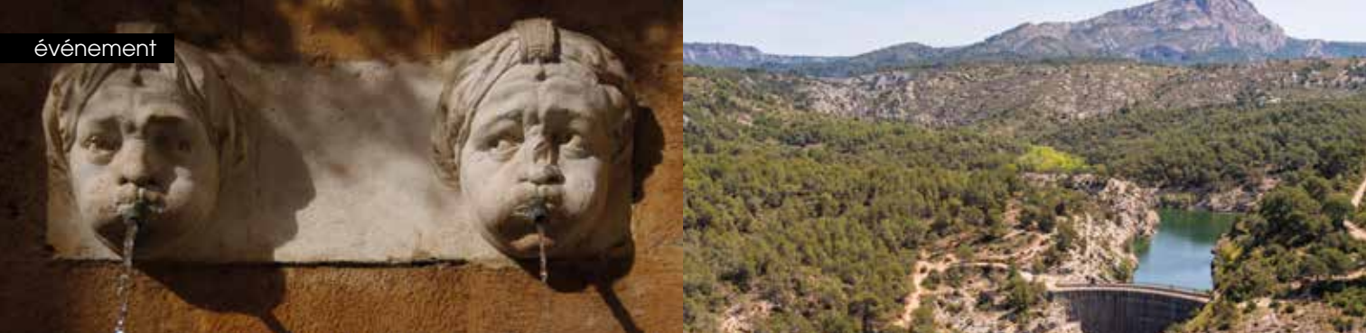
► Fontaine d'argent, angle des rues de la fontaine d'argent (ancienne rue des jardins) et de la mule noire