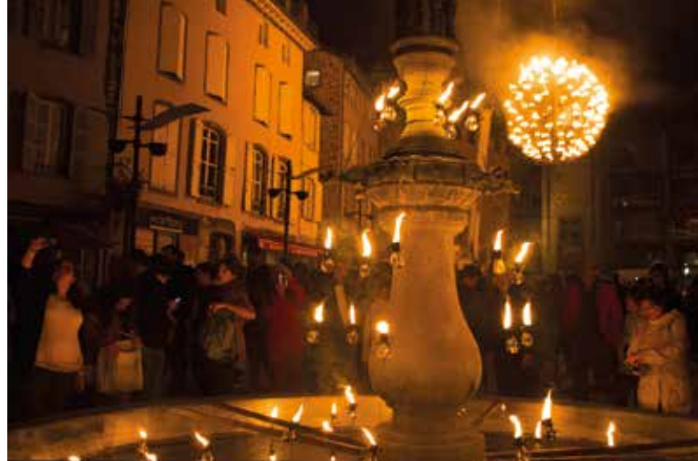
► Cie carabosse © Vincent Muteau