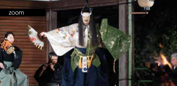
► Noh Kiyotsune