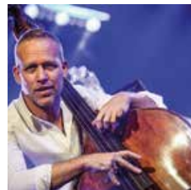
► Avishai Cohen Trio