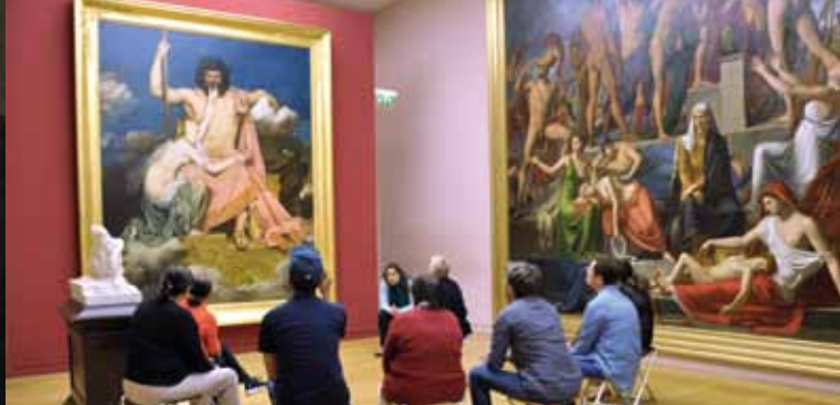
► © Musée Granet, Aix-en-Provence