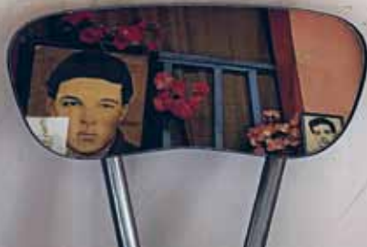
► Choral © Marie Padlewski