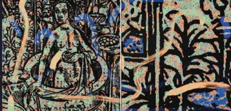
► Bethsabée au bain © Philippe Guesdon