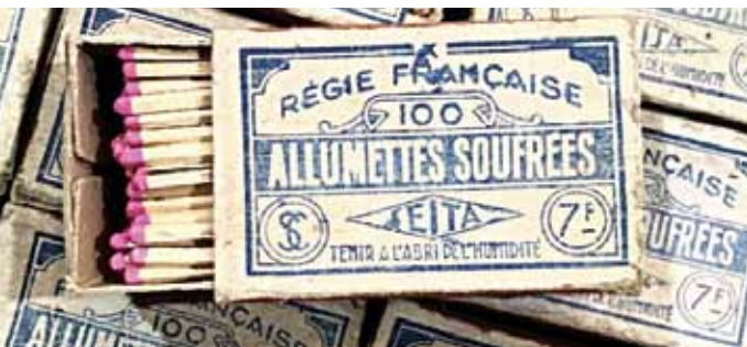
► Boîte d'allumettes soufrées de la SEITA