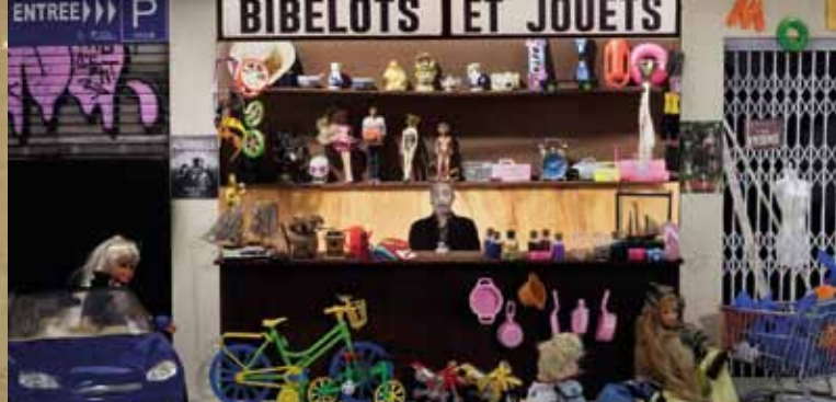
► Autoportrait « Bibelots », Série Bibeloterie, 2019 © Olivier Rebufa