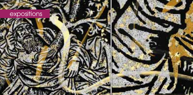
► L'Arbre de Jessé - Fragments des heures