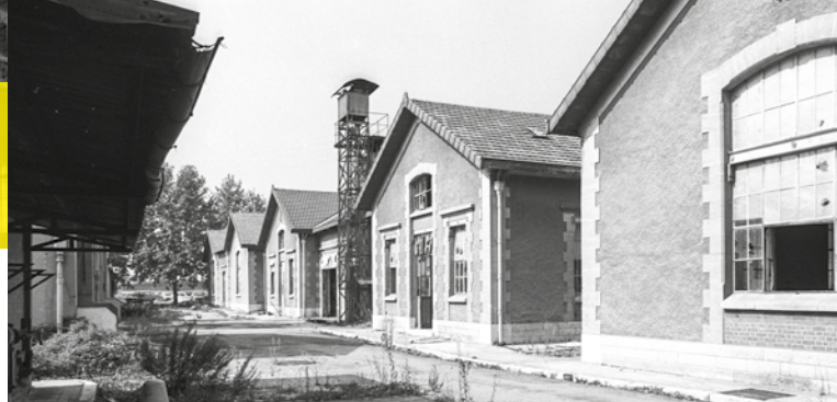
► Usine des Allumettes, 1981

Entre 1989 et 1993 les Petites Allumettes, alors en friche seront occupées à l'occasion de quelques manifestations culturelles dont Danse à Aix. Le 3 décembre 1993 naît la Cité du Livre qui réunit Petites et Grandes Allumettes. L'ancienne manufacture des allumettes, totalement réhabilitée autour de la fonction culturelle et de l'univers du livre, pose les premiers jalons du chantier Sextius Mirabeau puis de la création d'un grand pôle culturel à Aix en Provence.