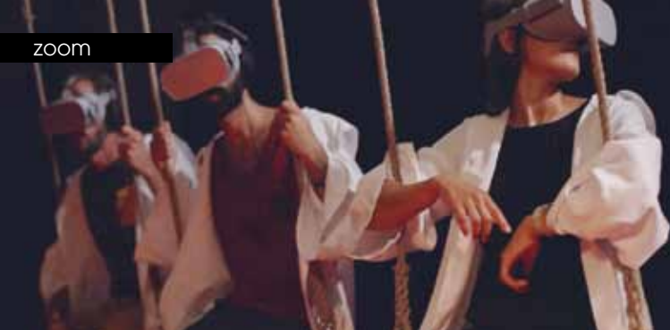
► © Tocq Alix Roques Genez