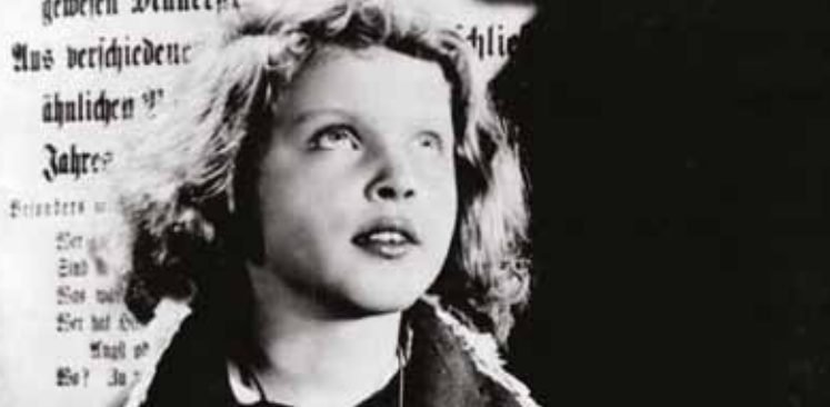
► M le maudit