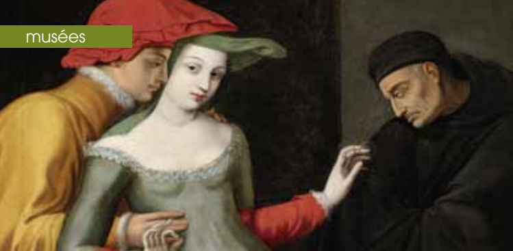
► École française, La Femme entre les deux âges, début 17 e siècle - Huile sur toile, 92 x 113 cm Donation Bourguignon de Fabregoules, 1860