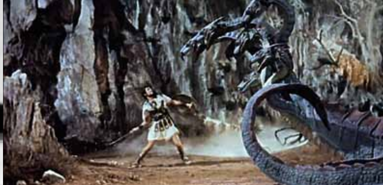
▶ Jason et les Argonautes