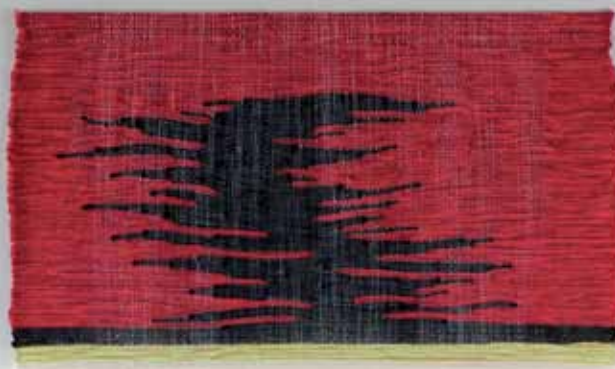
► Living Room

Renseignements : 09 51 71 47 56 - camille-moirenc.com