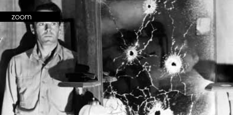
▶ J'ai le droit de vivre