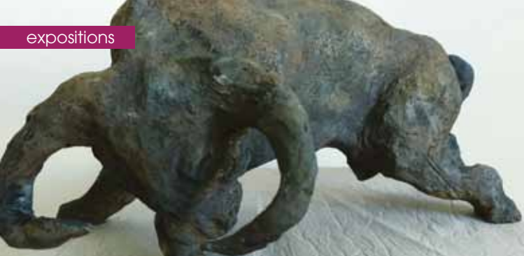
► Sculpture, Annie Dupuis-Minervini