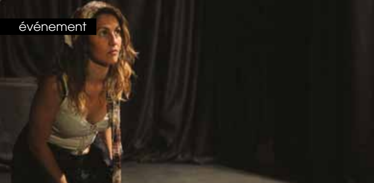
► Le cœur de la gitane