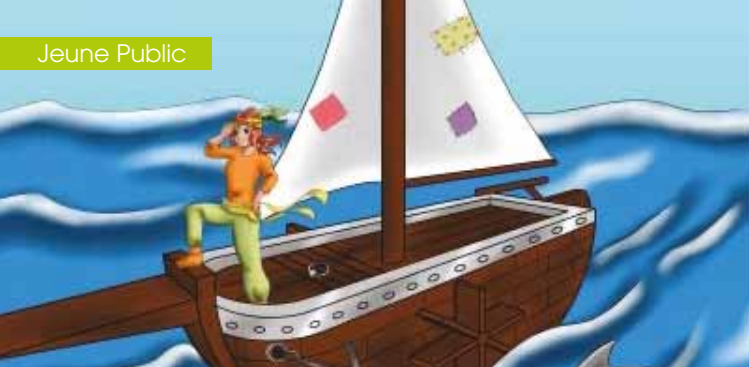
► © Gardienne de la mer