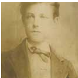
► © Rimbaud

➔ Salle Armand Lunel le 4 novembre à 18h30