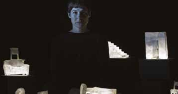
► Noir et humide

► Les représentations sont retransmises en direct sur la Chaîne PETIT DUC Web - connexion 5€