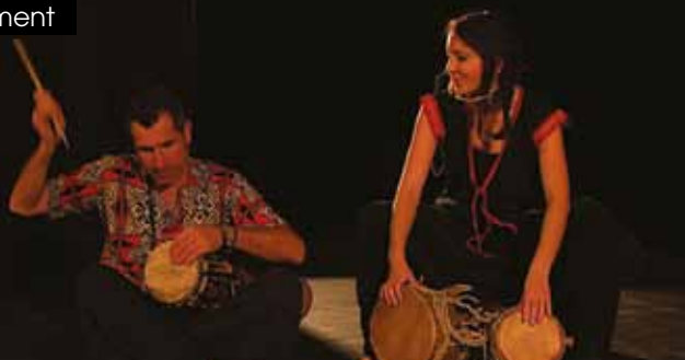
► Abene © Camille Chartier