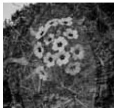
► « Les fragments d'Osvaldo », Floralties #2 © Jean Larive

Deux photographes nous baladent au fil de leurs images dans des fables... Une petite fille perdue dans ce monde d'adultes... Une recherche sur un poète voyageur dont on sait peu de choses... Venez-vous plonger dans ces deux univers... photographies de Thibaut Derien et Jean Larive.