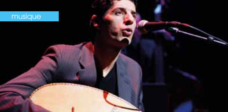
► © Kamel El Harrachi