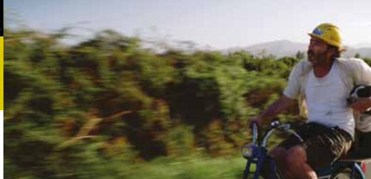
► Grab Them de Morgane Dziurka-Petit. Fiction. Suède. 2020