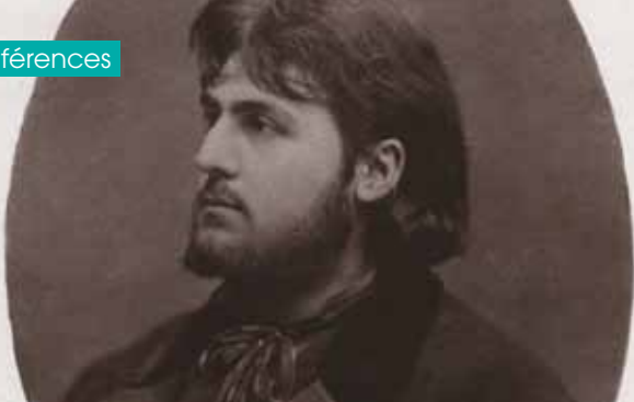
► Germain Nouveau : E Carjat, G Nouveau vers 1873, retrilage J Sereni après 1905 (bibliothèque Méjanès)