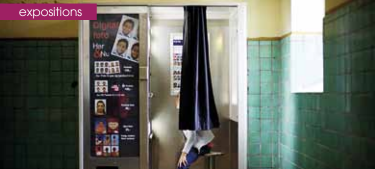
► « Angèle et le nouveau monde » Norrebro Station