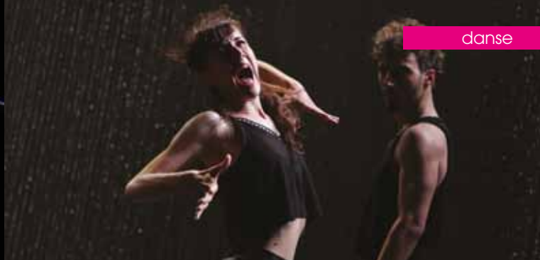
► Coup de grâce

► La Mareschale 27 avenue Tübingen Réservations : 04 42 59 19 71 - lamareschale.com