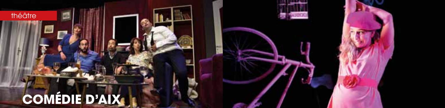
► Le prénom la petite moue